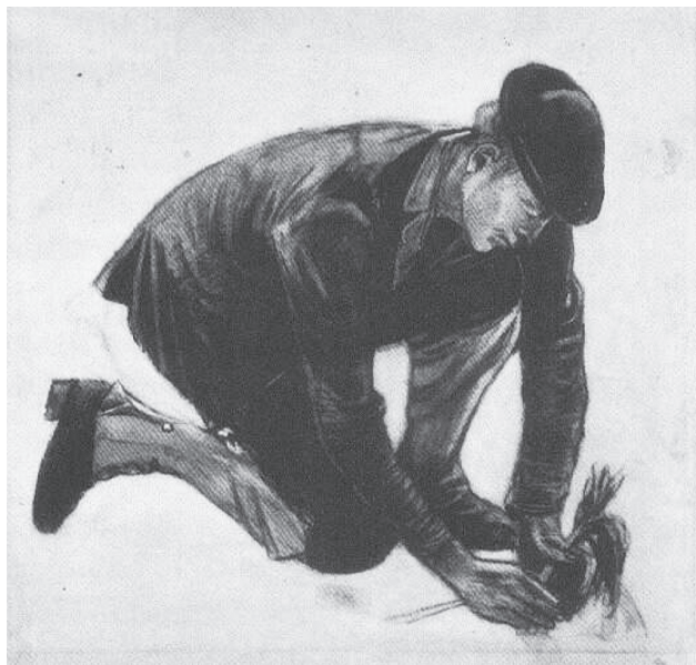
Vincent van Gogh (1853–1890) rajza