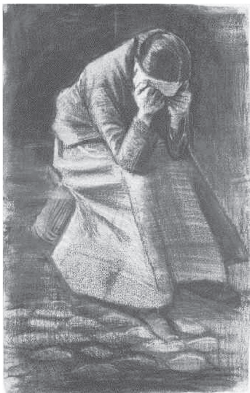
Vincent van Gogh (1853–1890) rajza

Nem tudom, felelem, azt hiszem, az lesz a legjobb, ha lemegek az országútra, és megpróbálok megállítani egy autót. Aztán majd rám támaszkodhatsz és lesántikálhatsz. Itt akarsz hagyni?, kérdezi elszontyolodva. Nem akarlak, de muszáj lesz. Hacsak nem akarsz odáig négykézláb jönni!, tréfálkozom, hogy felvidítsem. A fejét rázza: nem, azt azért nem. Elindulok lefelé, egy idő után már hallom az országúton elhaladó autók moraját. Iménti rettenetes rosszkedvem már szűnőben, hirtelen átjár a megkönnyebbülés. Most pár hétig nemigen tud majd kijárni a lakásból, gondolom, azért ez is valami. Nem sok, de valami.