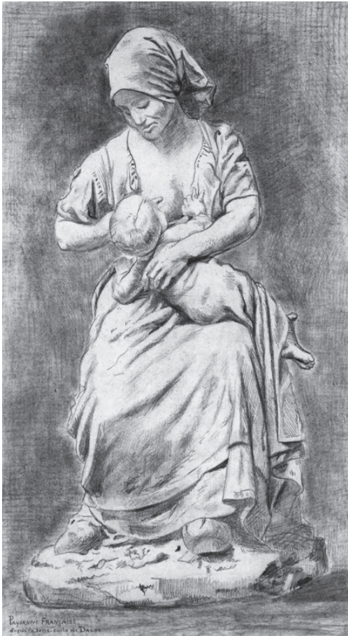
Vincent van Gogh (1853–1890) rajza