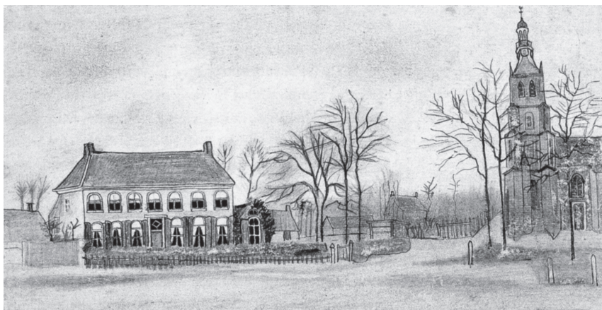
Vincent van Gogh (1853–1890) rajza